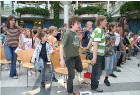
KinderUni "Der kleine Medicus" (2)