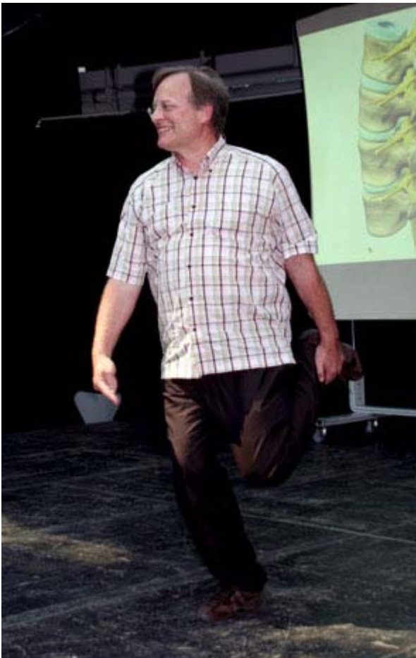
KinderUni "Der kleine Medicus" (3)