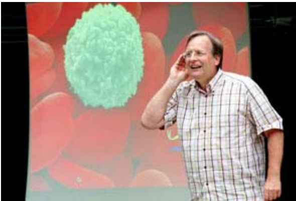
KinderUni "Der kleine Medicus" (1)

Zu dieser Meldung können wir Ihnen folgende Medien anbieten: