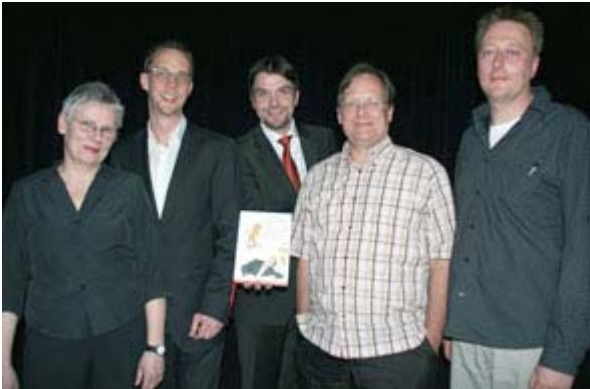
KinderUni "Der kleine Medicus" (5)